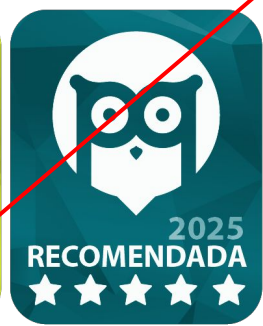
Com outras cores